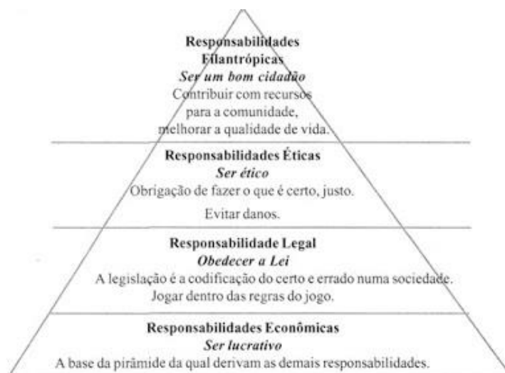
Figura 1. A Pirâmide da Responsabilidade Social Empresarial