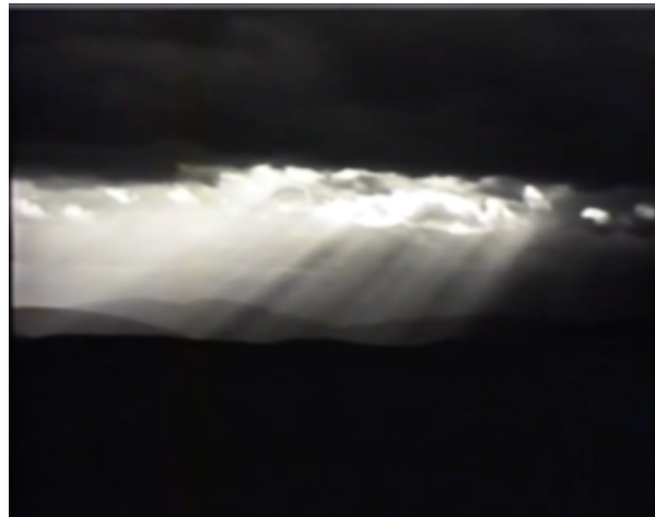
IMG. 12: Peter Hutton, Landscape (For Maron) (1987)

duração de planos, apesar de difícil, é algo importante para a globalidade de uma obra.