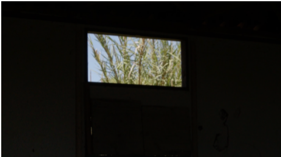
IMG. 15: Pretérito Mais-Que-Perfeito