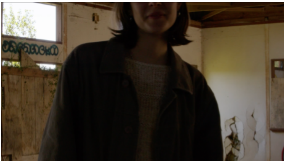
IMG. 16: Pretérito Mais-Que-Perfeito