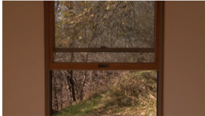
IMG: 11: Janela da cabana de Walden, James Benning, Two Cabins (2011)