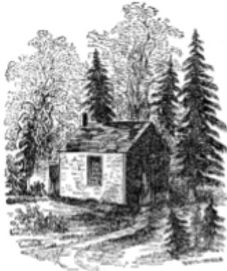
IMG. 10: Ilustração da cabana presente na capa de Walden , de Thoreau