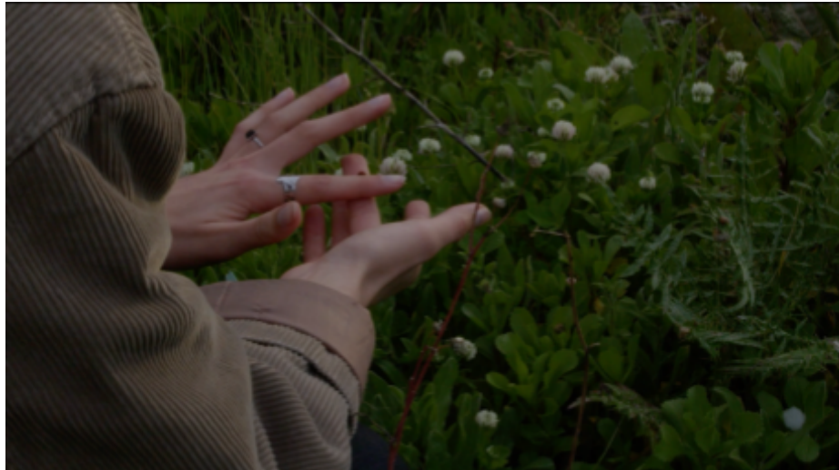
IMG. 14: Pretérito Mais-Que-Perfeito