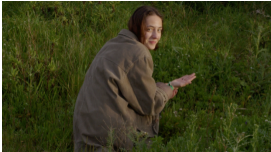
IMG. 18: Pretérito Mais-Que-Perfeito