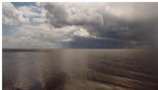
IMG. 6: James Benning, 13 Lakes (2004)