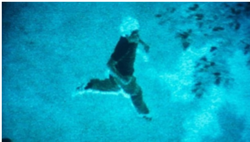
IMG. 9: Deborah Stratman, In Order Not to Be Here (2002)