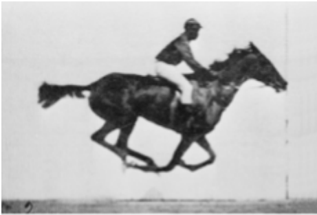
IMG. 1: Eadweard Muybridge, The Horse in Motion (1878)