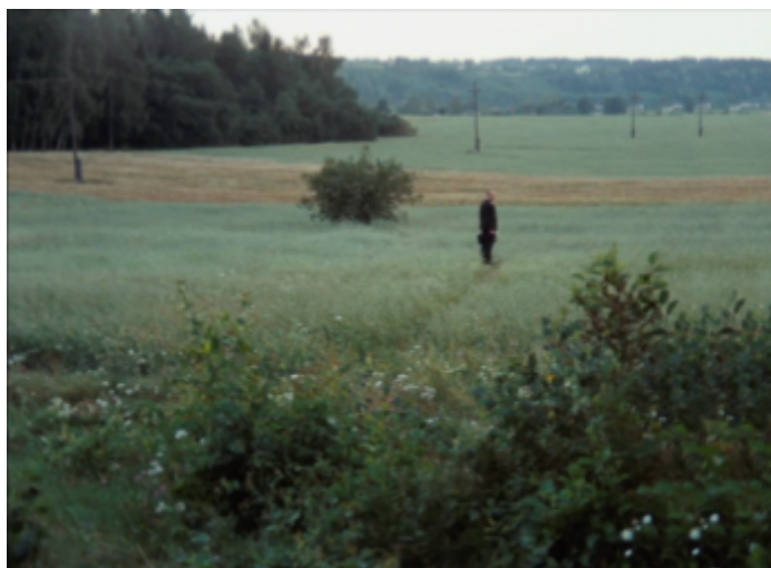
IMG. 4: Andrei Tarkovsky, Stalker (1979)

As perspectivas de Andrei Tarkovsky sobre o tempo cinematográfico também são algo que merece atenção. Tarkovsky, no seu livro “Esculpir no Tempo”, escreve sobre a sua crença no poder do cinema em poder captar e transmitir a passagem do tempo de uma maneira que reflete a experiência humana. Argumenta que o tempo no cinema não deve servir apenas como enredo, mas também deve ser uma parte importante do tecido emocional e filosófico da obra. Stalker (1979) (IMG. 4) e Nostalgia (1983), ambos filmes do realizador, são exemplos da sua abordagem ao tempo cinematográfico. São obras caracterizadas pelos takes longos e pelo ritmo contemplativo que nos convida, como espectadores, a experienciar o tempo de uma maneira mais íntima - “A imagem cinematográfica é essencialmente a observação do fenómeno que passa no tempo; o tempo torna-se uma entidade palpável, tangível como é na vida”. (Tarkovsky, 1987, p. 58)