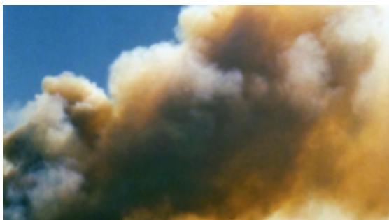
IMG. 5: James Benning, Ten Skies (2004)

“Tenho interesse em explorar as relações espaço-tempo através do cinema. Existe o tempo real e é a forma como percebemos o tempo. O tempo afeta a forma como percebemos o lugar. É daí que me surge a ideia de “olhar e ouvir”. Estou muito atento ao registo do local ao longo do tempo e à forma como isso faz compreender o local. Depois de observar algo durante algum tempo, tornas-te consciente disso de forma diferente. Podia mostrar-te uma fotografia do local, mas isso não te convence, não é a mesma coisa que ver o tempo. Estou muito interessado, agora, em quanto tempo é necessário para compreender o local.” (Benning, 2004)