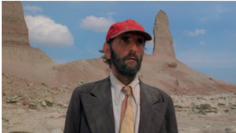
IMG. 13: Wim Wenders, Paris, Texas (1984)

A visão de Wim Wenders em Paris, Texas é de empatia. Através do filme, convida os espectadores a refletir sobre as suas próprias experiências de amor, algo que pode, de certa forma, se conectar com o meu projeto para além das compatibilidades técnicas e temáticas.