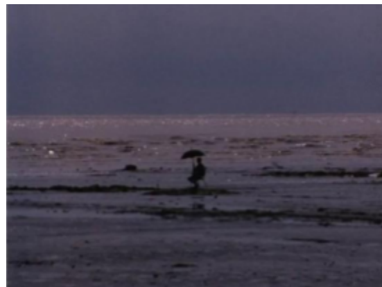
IMG. 8: Peter Hutton, At Sea (2007)