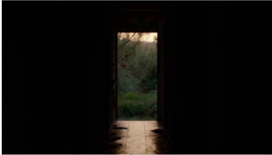
IMG. 17: Pretérito Mais-Que-Perfeito