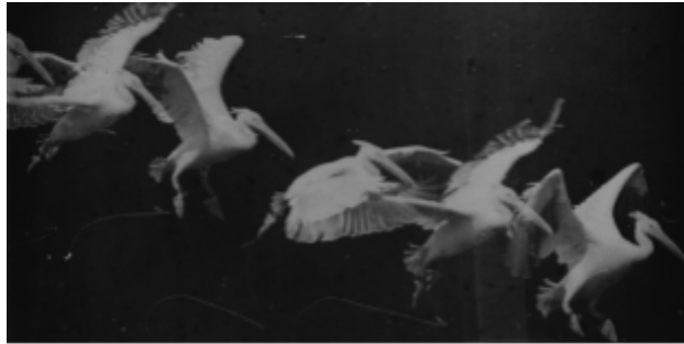
IMG. 2: Étienne-Jules Marey, The Flight of the Pelican (1882)

Realizadores pioneiros, como Georges Méliès, fizeram algumas experiências nos primórdios da sétima arte - técnicas como stop-motion - para criar efeitos e ilusões. "O uso inovador de stop-motion e outros efeitos especiais por Méliès deu-nos uma compreensão inicial do potencial do cinema para manipular o tempo" (Manovich, 2001, p. 120). A edição tornou-se essencial desde o primeiro minuto, revolucionando a maneira como o tempo pode ser representado. O trabalho de Edwin S. Porter, particularmente em The Great Train Robbery (1903), mostrou o poder da edição para representar ações simultâneas, melhorando a complexidade narrativa - "Em The Great Train Robbery , Porter utilizou a edição para mostrar ações simultâneas, demonstrando como a manipulação temporal poderia aumentar a complexidade narrativa" (Bordwell & Thompson, 2010, p. 56).