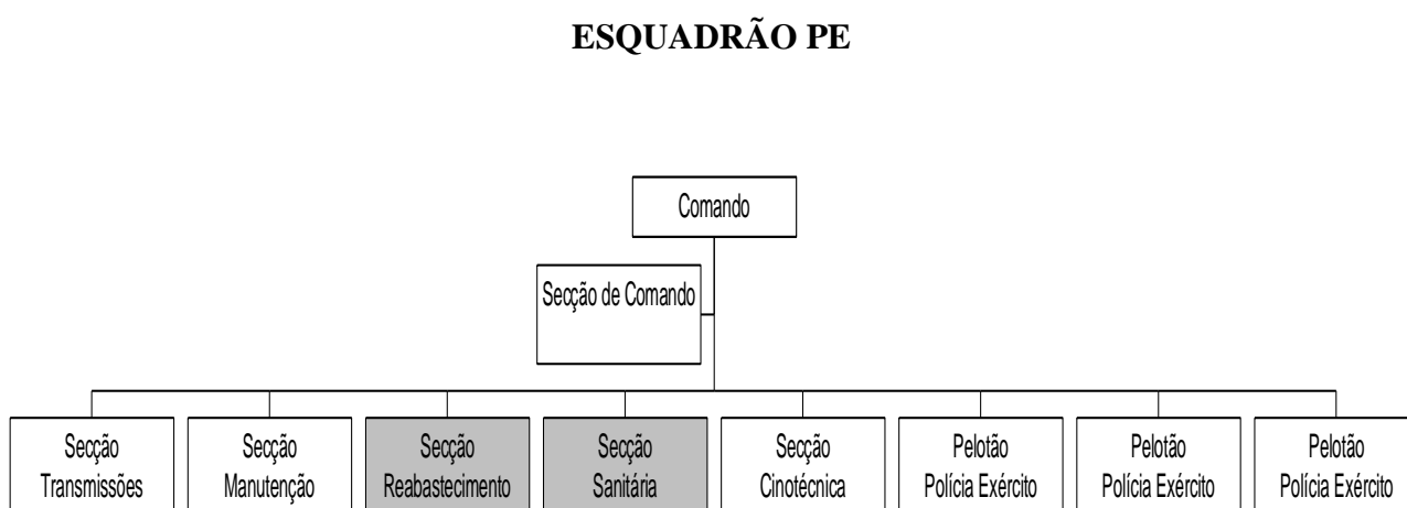
Figura 2.4: Organograma do Esquadrão PE