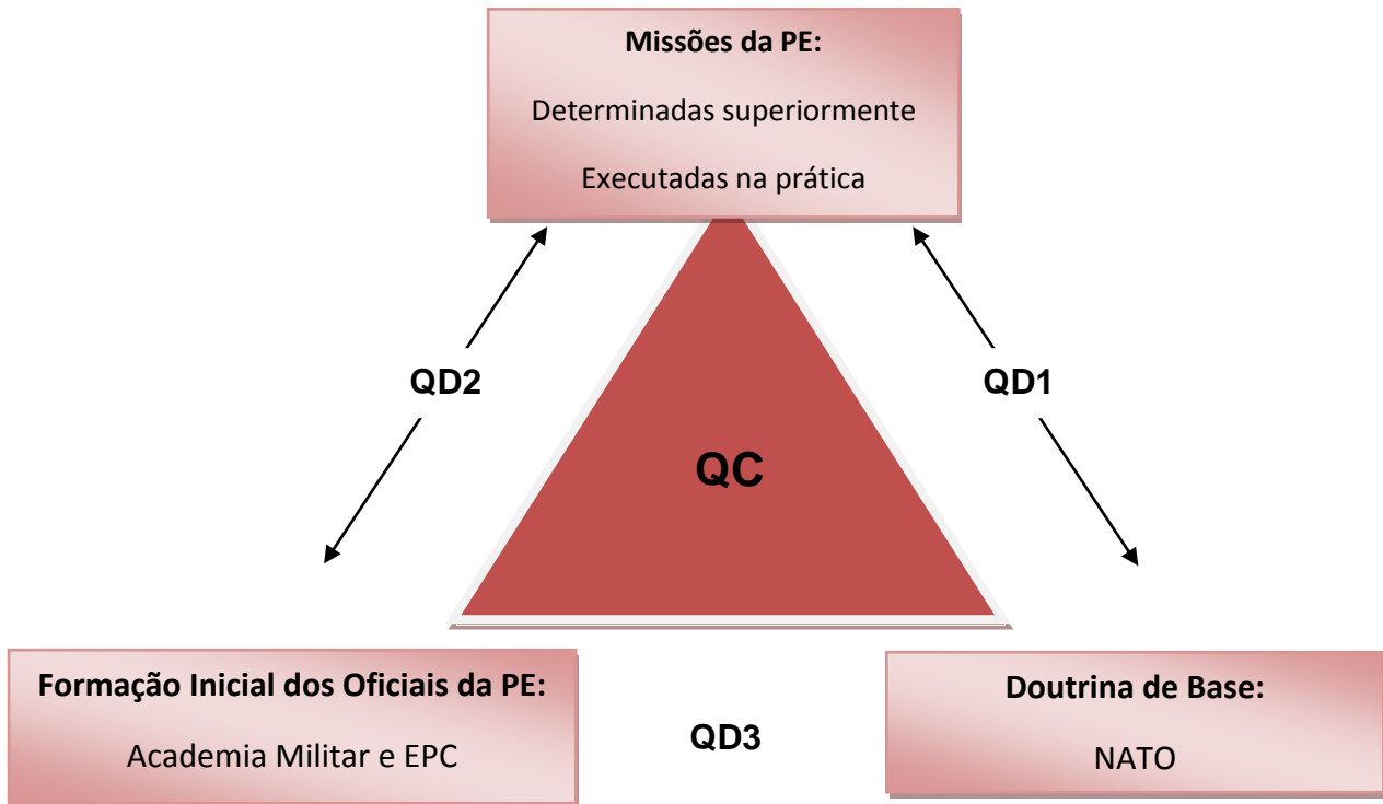
Figura 1. Diagrama da QC e QDs

durante o curso da Academia Militar e, numa segunda fase, na Escola Prática de Cavalaria, e perceber de que forma as suas missões como oficiais da PE estão orientadas pela doutrina regente.