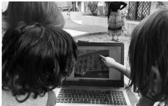
Figura 8 – Memórias partilhadas para um caminho cartografado

Numa reunião de conselho foi lançado o desafio de sairmos da escola, explorarmos e conhecermos os diferentes espaços verdes à volta da nossa escola. Combinamos que iríamos em pequenos grupos aos diferentes espaços e que no tempo das comunicações partilharíamos as nossas descobertas e vivências com o restante grupo.