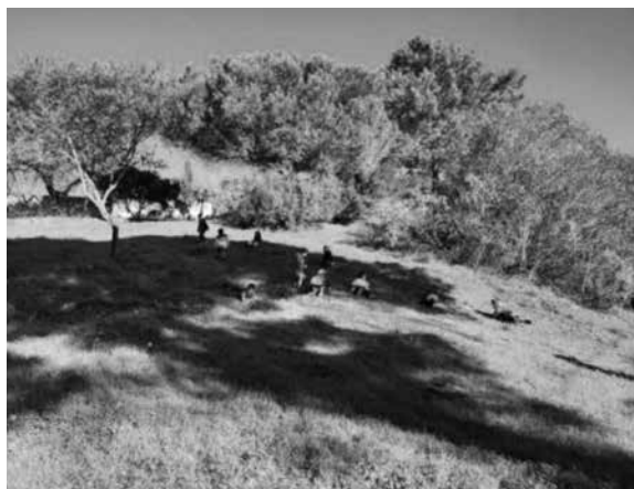
Figura 1 – Rebolar

O contacto íntimo com o mundo natural foi progressivamente propiciando e promovendo nas crianças o esquecimento da estrutura estandardizada e a adoção de novas formas de interação com o ambiente: exploraram a mata, inventaram brincadeiras novas, aprenderam a criar com os materiais que esta oferecia, subiram às árvores, aproveitaram os declives para rebolar ( Figura 1 ), saltaram, observaram, mas também pararam e escutaram os sons envoltos na mata ( Figura 2 ). Assim tiveram a possibilidade de viver/experienciar a natureza na sua plenitude, algo que só foi possível devido às nossas idas frequentes à mata.