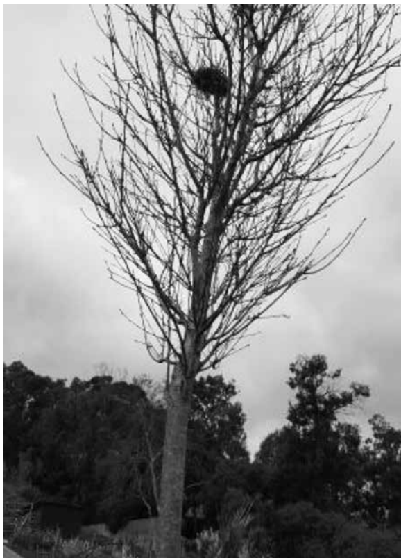
Figura 9 – Árvore com o ninho

sei que os passarinhos têm frio. E os ovos precisam de quentinho.