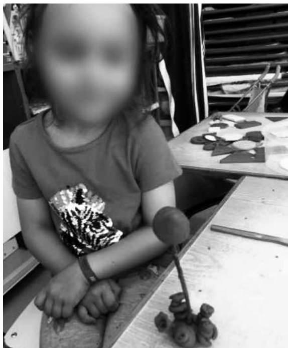
Figura 4 – Árvore em plasticina