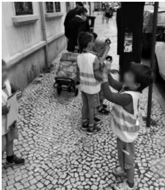
Figura 7 – A mesma rua diferentes perspetivas

Prova disto é um momento específico em que, entre máquinas fotográficas que passam de mão em mão, olhos que espreitam e cheiram o interior do cabeleireiro, parte do grupo suspende-se após um “Bom dia!” seguido de uma mão que se estende com um ramo de hortelã que é dado a cheirar. Entre vários sentidos ativados, destaca-se o cheirar daquele ramo seguido de instruções e ideias culinárias para que poderá este servir “Cheira bem, queres cheirar? É hortelã! Dá para pôr na canja e no cozido!”. Visto nem todas as crianças estarem