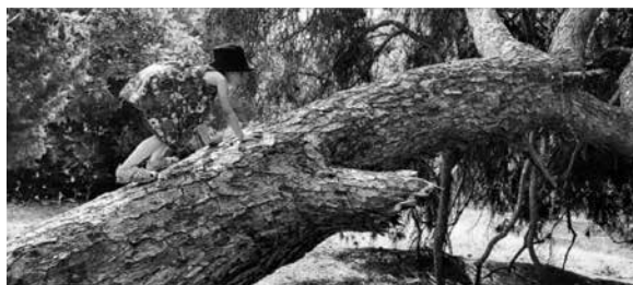
Figura 6 – Subir a árvore