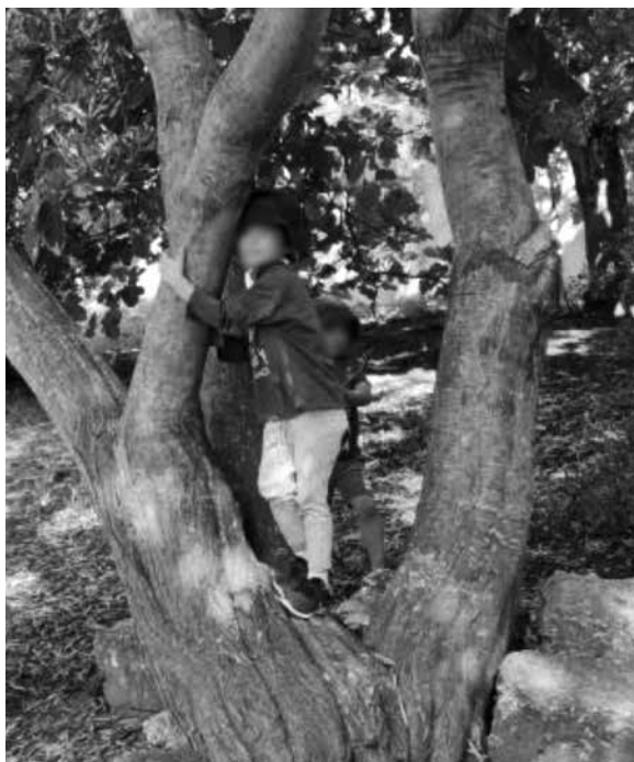
Figura 3 – Abraço à árvore

Estas interações foram-se multiplicando e diversificando, de tal modo que durante o tempo de atividades e projetos as crianças que escolhiam a modelagem recriavam as suas árvores favoritas