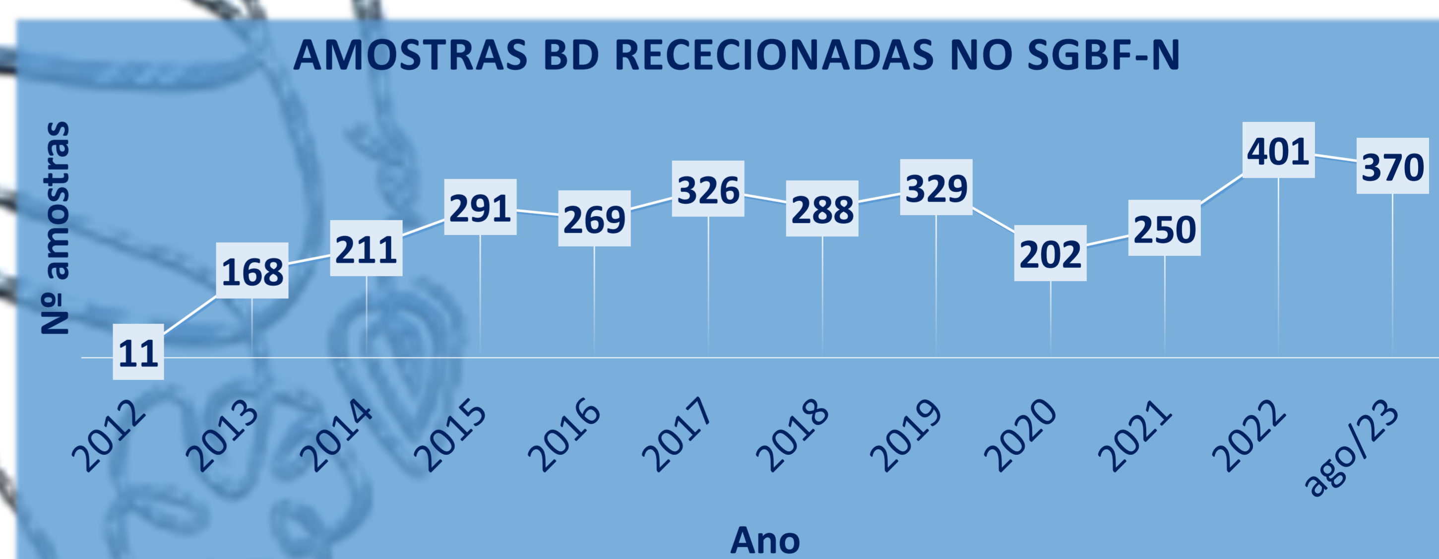
Gráfico 1 – Distribuição do número de pedidos de colheita recebidos pelo SGBF-N nos últimos 10 anos.

Observando os dados acima apresentados, tanto referentes a questões laboratoriais como burocráticas, é possível constatar que, apesar das tarefas mais burocráticas se terem tornado da inteira responsabilidade da BDADN, a perícia BD continua a ser de uma exigência humana, organizacional e mesmo burocrática muito elevada. Durante um longo período de tempo, a BD de ADN encontrar-se-á numa fase de transição entre os processos totalmente iniciados e preparados no SGBF-N (e.g. que aguardam colheita pelo LPC) e os que já foram iniciados pela BDADN, requerendo da parte dos peritos um cuidado suplementar.