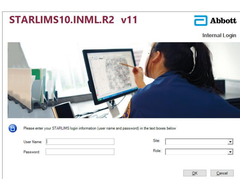
Figura 2– Plataforma StarLims

O objetivo deste trabalho foi o levantamento dos casos de suicídio por nitrito de sódio ocorridos em Portugal, desde o ano de 2020, ano em que surgiu o primeiro caso no nosso país. Através da plataforma StarLims , foram detetados dois casos de suicídio por este composto em 2020, três casos em 2021 e quatro casos no corrente ano de 2023.