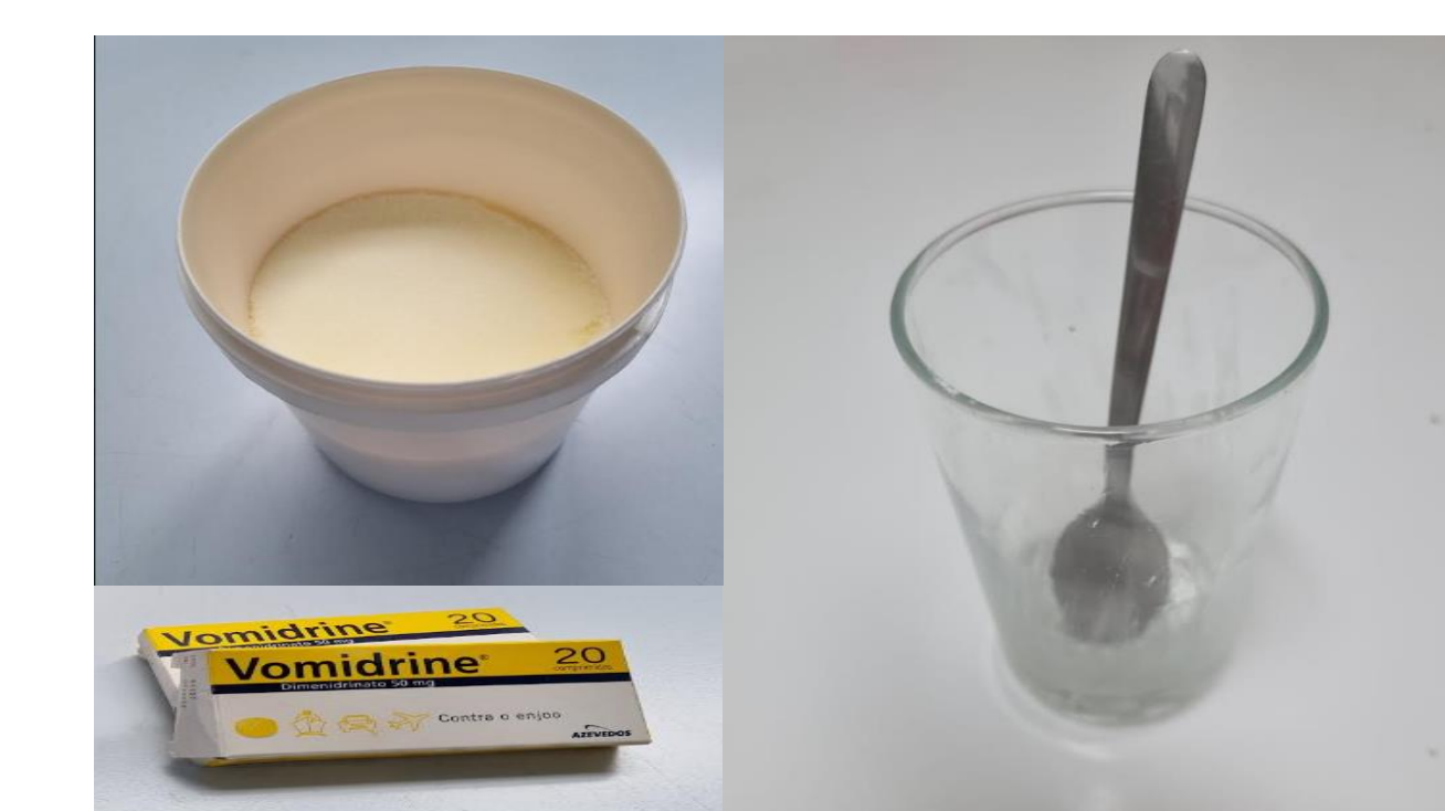
Figura 5– Parafernália envolvida.