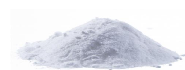
Figura 1– Embalagem comercial de nitrito de sódio.

Informações e kits de suicídio contendo este composto podem ser facilmente obtidos online, sendo frequentemente aconselhada a toma concomitante de medicação para minimizar a sintomatologia, como por exemplo, anti-eméticos.