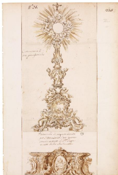
Fig. 11 – Custódia da Capela de São João Batista