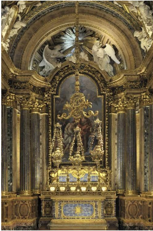
Fig. 2 – Capela de São João Batista Luigi Vanvitelli, Nicola Salvi e João Frederico Ludovice; 1742-1752 Igreja de São Roque, Lisboa