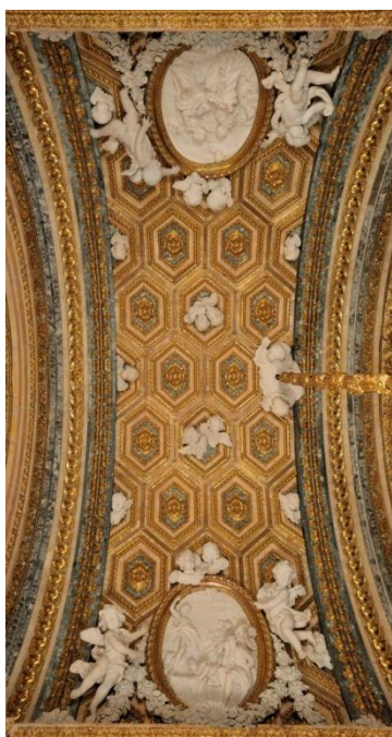
Fig. 6 – Teto da Capela de São João Batista Luigi Vanvitelli, Nicola Salvi e João Frederico Ludovice; 1742-1752 Igreja de São Roque, Lisboa

um deles cobrir uma abóbada de volta perfeita (São João Batista) e o outro uma cúpula de perímetro elíptico (Sant'Andrea). Destaca-se, designadamente, o revestimento com caixotões hexagonais em metal dourado com florões no interior, os frisos delineando as principais linhas de descarga, e a decoração valorizada com escultura de anjos e querubins em mármore branco, que assume maior concentração nas zonas onde o teto se encontra com as paredes verticais.