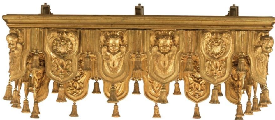
Fig. 10 – Baldaquino da Capela de São João Batista