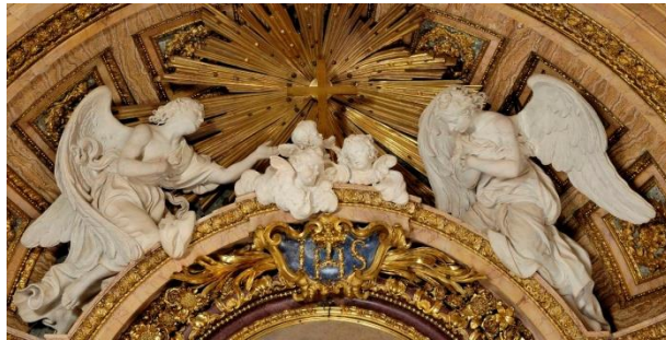
Fig. 4 – Remate da Capela de São João Batista Luigi Vanvitelli, Nicola Salvi e João Frederico Ludovice; 1742-1752