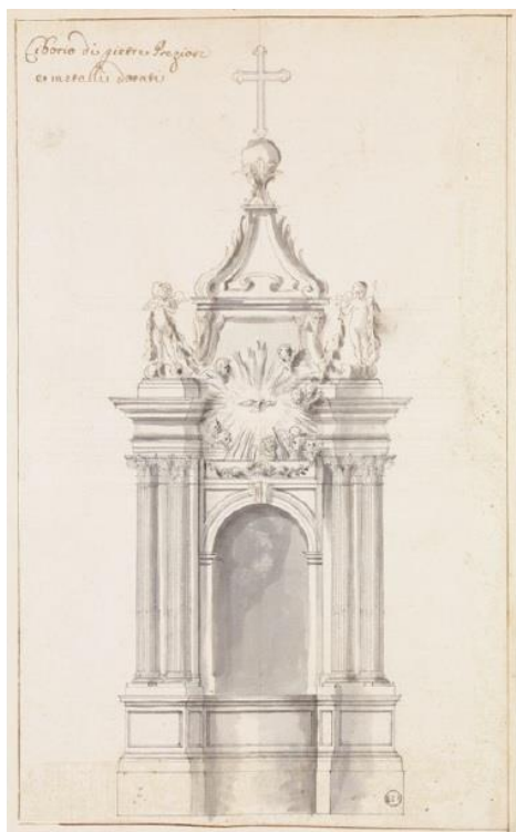
Fig. 9 – Sacrário da Capela de São João Batista

João Frederico Ludovice, Luigi Vanvitelli e Antonio Arrighi, 1742-1749