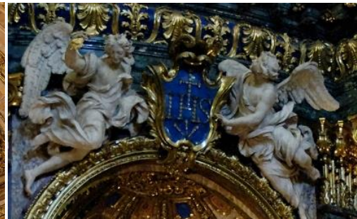
Fig. 5 – Remate do Altar de Santo Inácio de Loyola Andrea Pozzo, 1695-1699 Chiesa del Gesù, Roma

Já a Igreja de Sant'Andrea al Quirinale [Fig. 7] — outro conhecido exemplo do barroco romano, igualmente Jesuíta e feita por Bernini entre 1658 e 1661 — apresenta um teto que claramente ecoa no da Capela de São João Batista, com a particularidade de