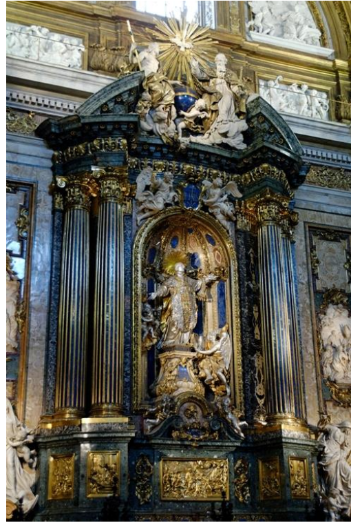
Fig. 3 - Altar de Santo Inácio de Loyola Andrea Pozzo, 1695-1699 Chiesa del Gesù, Roma