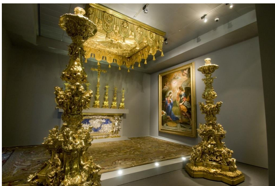
Fig. 14 – Vista do núcleo do tesouro da Capela de São João Batista do Museu de São Roque

A Capela de São João Batista e todo este conjunto de alfaias litúrgicas, unanimemente reconhecido pelos especialistas como dotado de um “ carácter único ” 47 — pela qualidade individual de cada peça, pela coerência do conjunto como um todo, pelos artistas envolvidos, pelo estado de preservação em que se encontra, e pela excecionalidade do processo da sua encomenda (verdadeiramente “ prodigiosa ”) — podem ser fruídos pelo público desde 1905 no atual Museu de São Roque [Fig. 14], pertencente à Santa Casa da Misericórdia de Lisboa, constituindo esta a coleção que está na base da criação do museu, batizado naquele ano, justamente por esse motivo, como o Museu do Tesouro da Capella de São João Baptista .