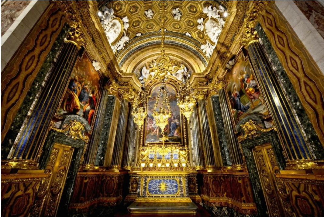
Fig. 1 – Capela de São João Batista

Luigi Vanvitelli, Nicola Salvi e João Frederico Ludovice; 1742-1752