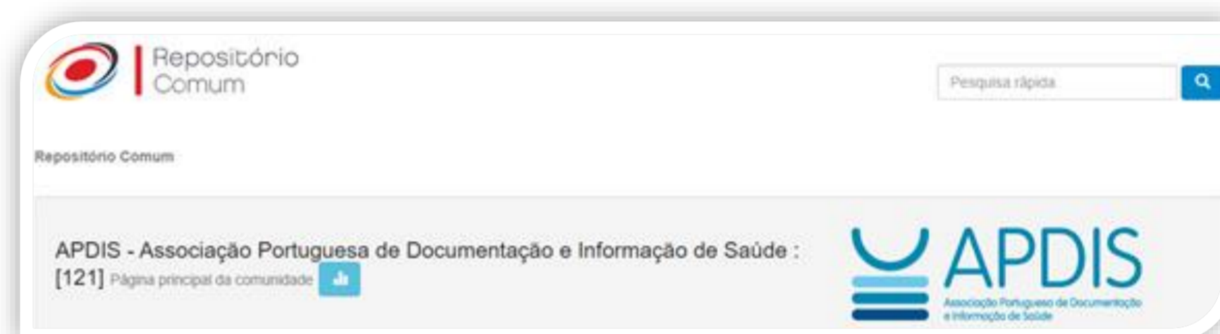
Figura 1 – Repositório APDIS

O Repositório APDIS (criado em março de 2019) possui 121 documentos e 210 downloads .