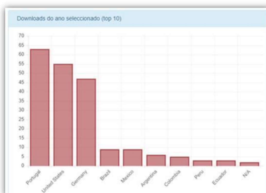
Figura 3 – Repositório APDIS – Downloads por países