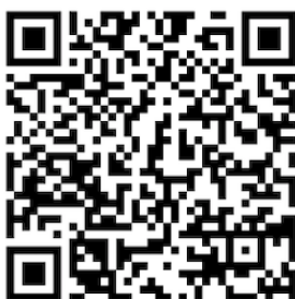
Figura 2 Código QR

Assim para a recolha das respostas do questionário de cada aluno, será preciso registar o número de aluno e assim relacionar a parte do questionário com os dois registos dos índices (CPOD e BEWE). Para além disso, o futuro aluno participante poderia interrogar o proponente consoante as perguntas que podem ser mal percebidas mal-entendidas, ou até mesmo compreender a importância e relevância desses fatores.