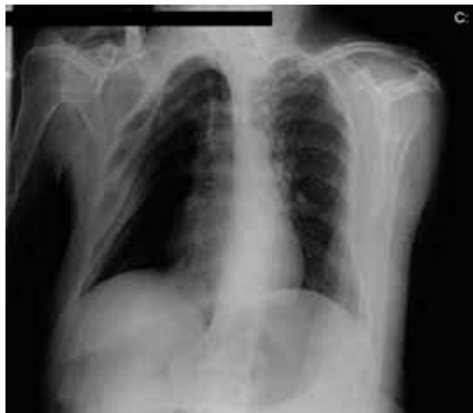
Fig. 1 – Radiografia do tórax mostrando alterações anatómicas grosseiras, decorrentes de posturas viciosas, sendo evidente a hipertransparência relativa do hemitórax direito, rotação esquerda e dificuldade em avaliar o trajecto e a permeabilidade das vias aéreas centrais

nico, o estridor, foi solicitada a observação por ORL, de modo a descartar obstrução alta das vias respiratórias, não sendo aparente, na avaliação realizada, qualquer alteração que pudessem explicar o quadro. A doente é então internada com o diagnóstico provisório de DPOC agudizada, possivelmente complicada por obstrução das vias aéreas superiores por edema e deformidades esqueléticas e da postura associadas, a necessitar de clarificação posterior. Durante o internamento verifica-se uma resposta pouco satisfatória às medidas instituídas, mantendo-se o quadro de estridor, inclusive