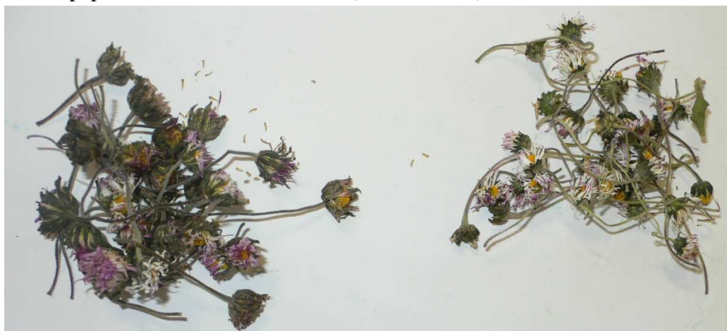
Figura 1 – Amostra de B. sylvestris (esquerda) e de B. perennis (direita).

As folhas da B. sylvestris são verde escuras (30-180x5-25 mm), trinérvias, oblongas a oblongo-obovadas, remotamente serradas a sub-inteiras; o pecíolo é curto e pouco distinto. O pedúnculo (10-45 cm) das inflorescências é robusto e não é aclavado junto ao capítulo. Os capítulos (20-40 mm de diâmetro) têm um receptáculo cónico a hemisférico. As flores liguladas têm 8-14mm. Os frutos são cipselas pubescentes, por vezes com pilho de escamas setiformes (Franco, 1984).